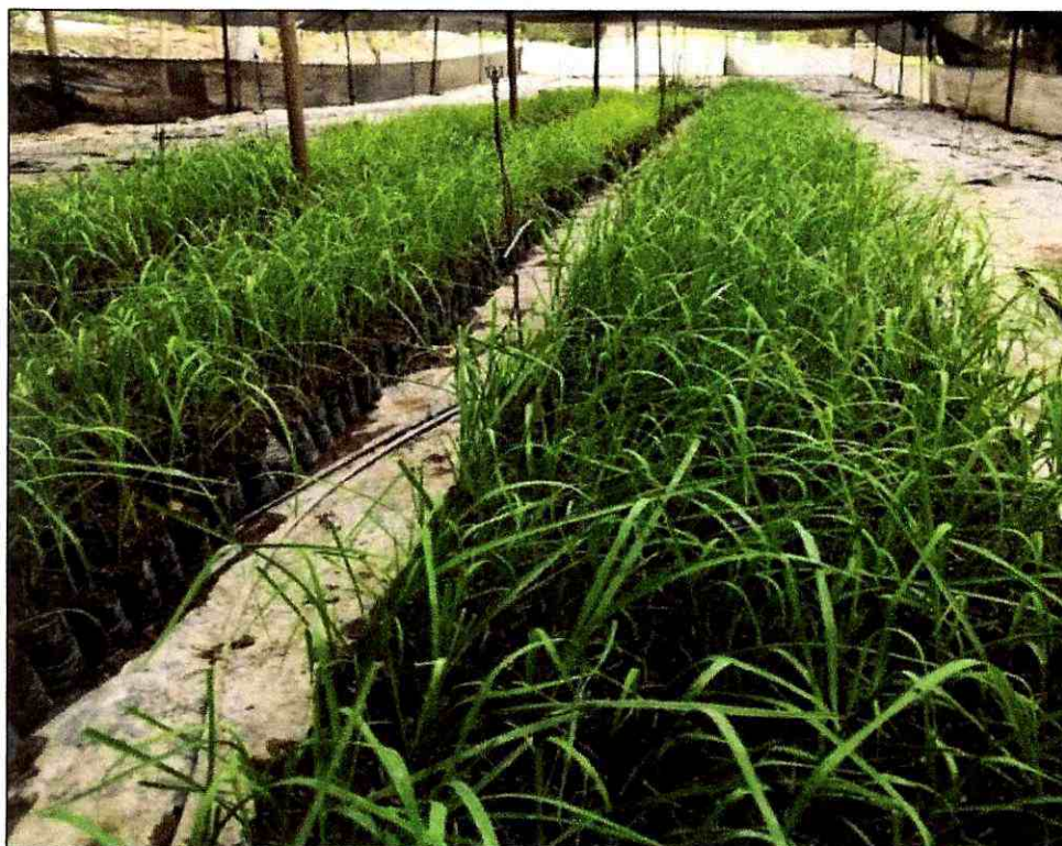
Fotografía 3. Registro SPOOL