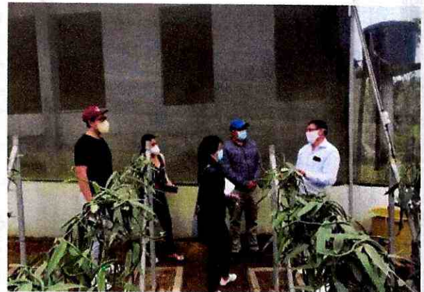
Fig 6. Personal en visita