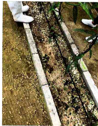
Fig 4. Sistema de riego y Bordillo