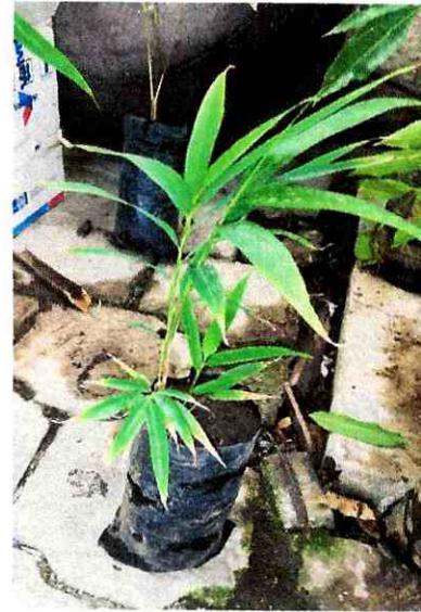
Fig 13. Planta de bambú