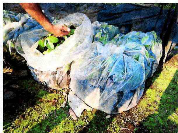
Fig 8. Climatización de injertos