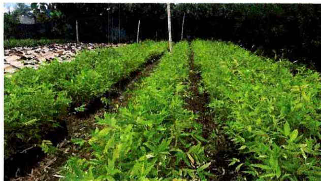
Fig 11. Viveros de bambú

Es un vivero especializado en la producción de plantas de bambú nativas e introducidas en Ecuador, está ubicado en la ciudad de Pedernales.