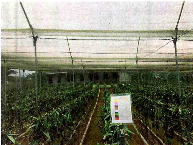
Fig 1. Vivero de Vainilla (vista 1)

Se recorrieron todos los invernaderos existentes, resaltando la obra civil necesaria como: construcción de invernadero, sistema de riego y sistema de protección; adicionalmente, la polinización y mantenimiento de la planta es realizado por ingenieras, de manera exclusiva.