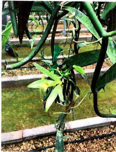
Fig 3. Vainilla Thaitensis