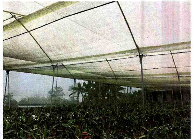
Fig 2. Vivero de Vainilla (vista 2)