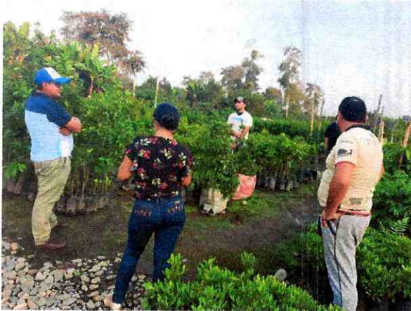
Fig 9. Personal en visita