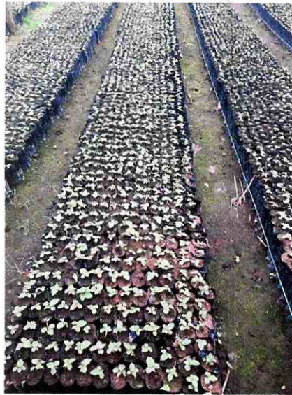
Fig 12. Viveros de bambú