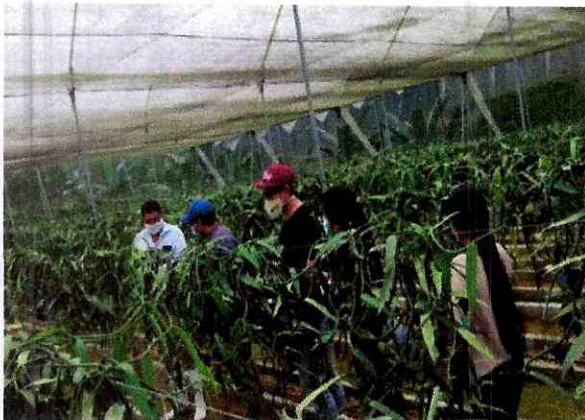
Fig 5. Personal en visita