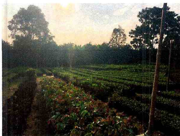
Fig 7. Vivero

En el vivero se presentan plantas cítricas, maderables y ornamentales, listas para su comercialización desde pequeñas, medianas y grandes.