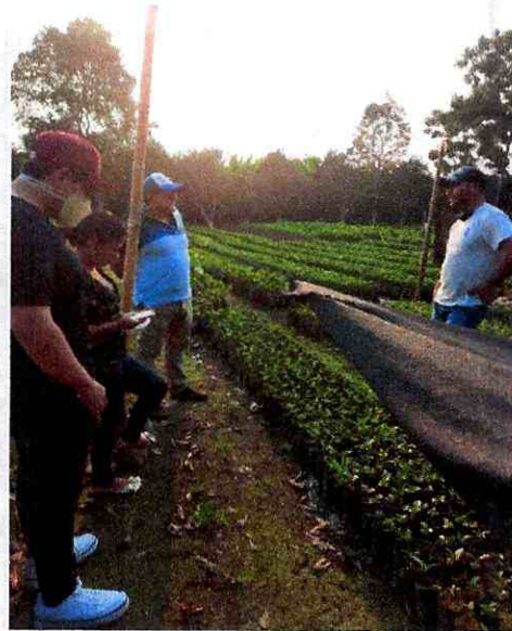
Fig 10. Personal en visita