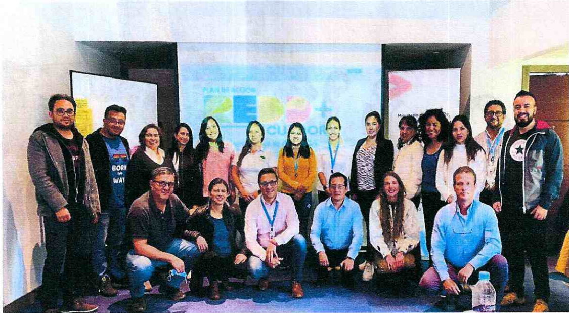
FOTOGRAFÍAS DÍA 2. 22 de noviembre de 2022