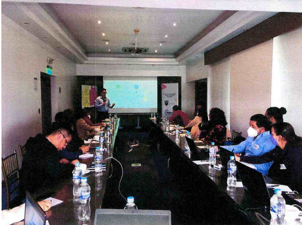
FOTOGRAFÍAS DÍA 1. 21 de noviembre de 2022