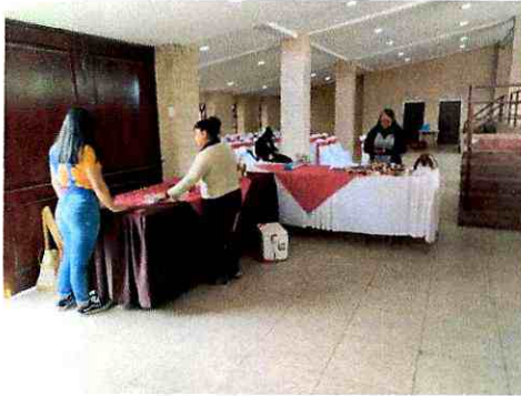
Imagen 1: Adecuación de stands