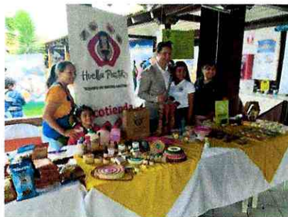
Imagen 3: Emprendimientos participantes junto al Prefecto de Chimborazo