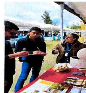
Imagen 6: Levantamiento de información de ventas