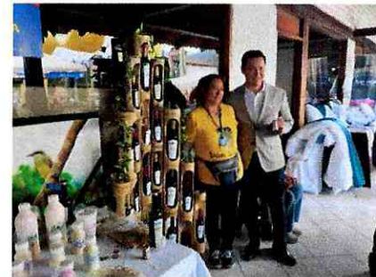
Imagen 4: Emprendedores participantes