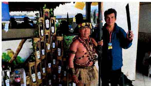
Imagen 5: Emprendimientos participantes en el ENTUR 2022