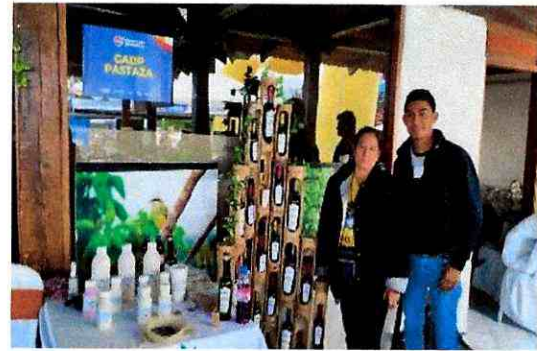
Imagen 2: Emprendimientos participantes en el ENTUR 2022