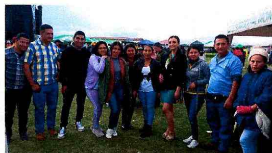
Imagen 4: Emprendedores participantes