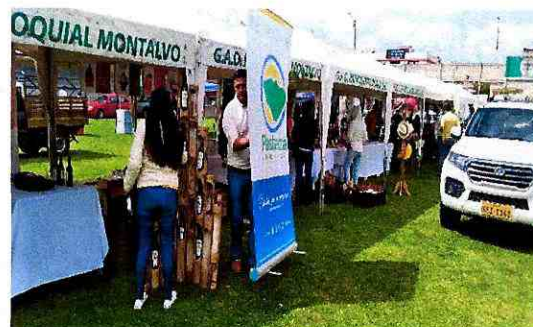
Imagen 2: Desembarque de productos y adecuación de stands