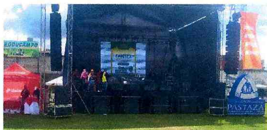
Imagen 5: Intervención de emprendedores