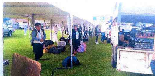
Imagen 6: Desembarque y adecuación de stands