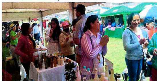
Imagen 3: Venta y exposición de productos