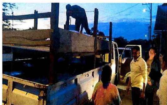
Imagen 1: Embarque de productos de los emprendimientos