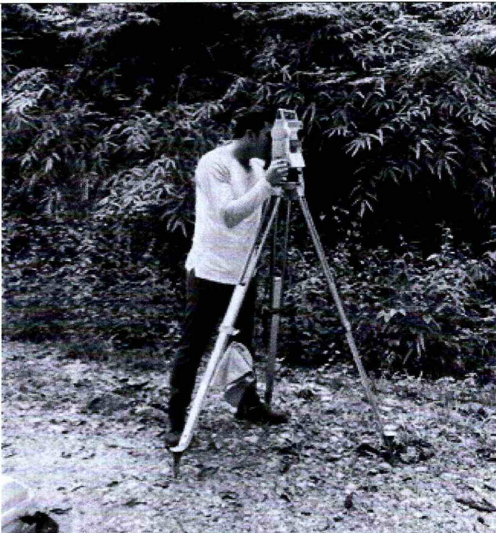
Foto 1: Colocación, Nivelación y ajuste de Estación Total Geomax para Levantamiento Topográfico