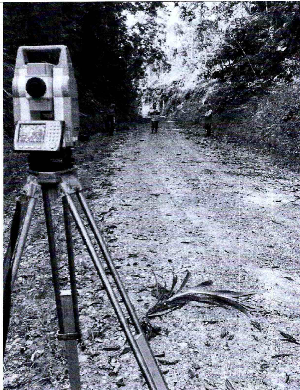
Foto 3: Levantamiento topográfico para proyecto de asfaltado en la Comunidad Meñenpare abscisa 2+500