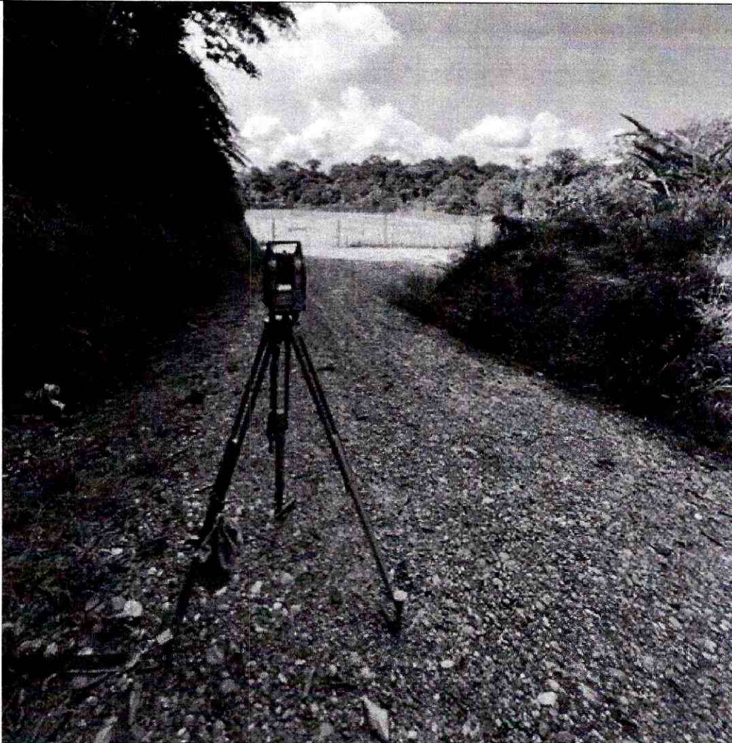
Foto 4: Llegada de levantamiento topográfico del proyecto de asfaltado a la plataforma petrolera abscisa 4+200