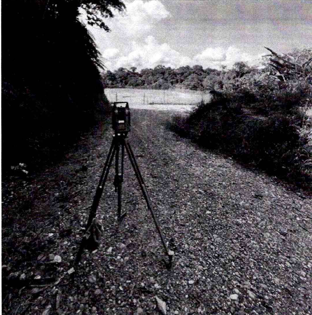
Foto 4: Llegada de levantamiento topográfico del proyecto de asfaltado a la plataforma petrolera abscisa 4+200