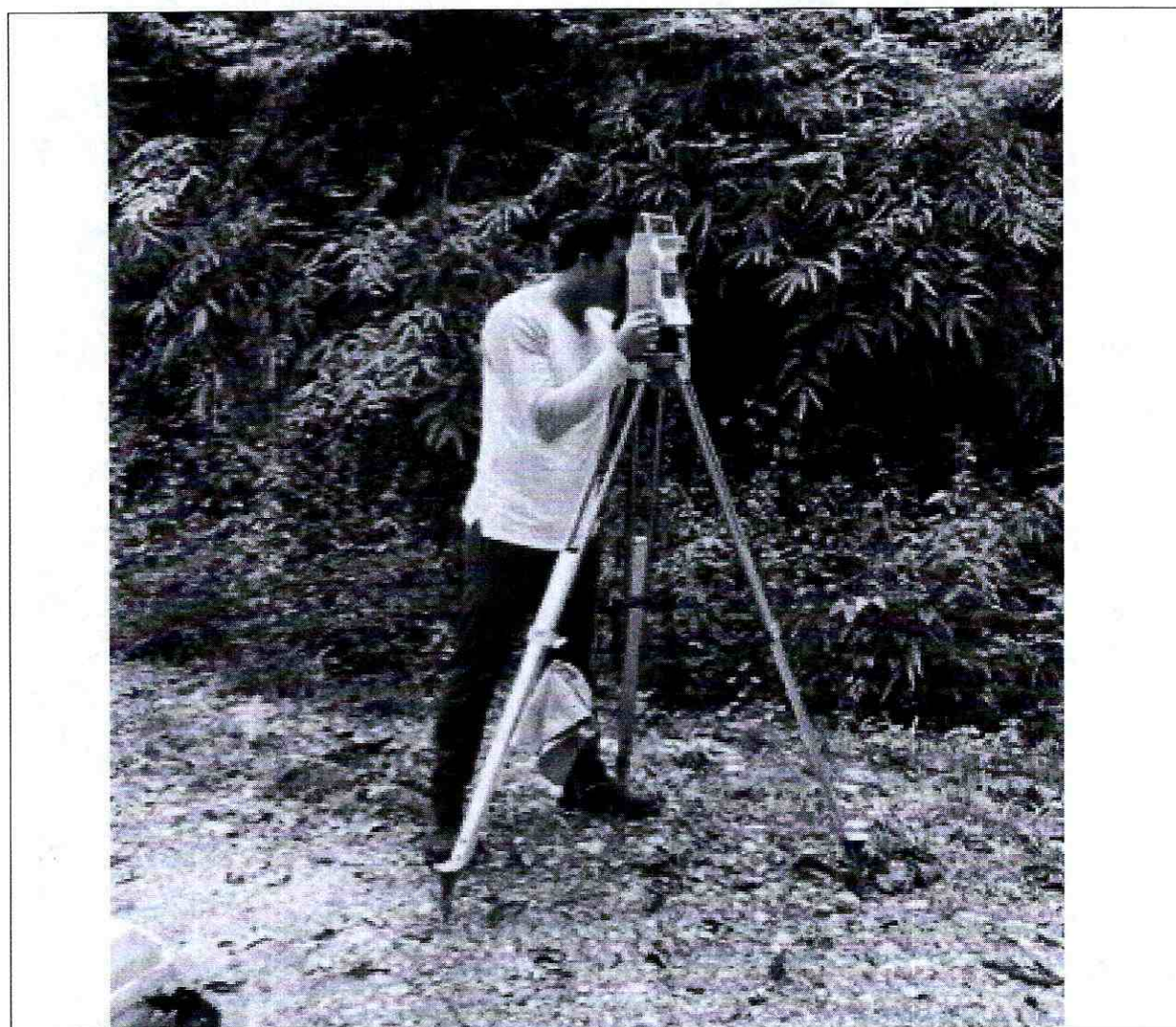
Foto 1: Colocación, Nivelación y ajuste de Estación Total Geomax para Levantamiento Topográfico