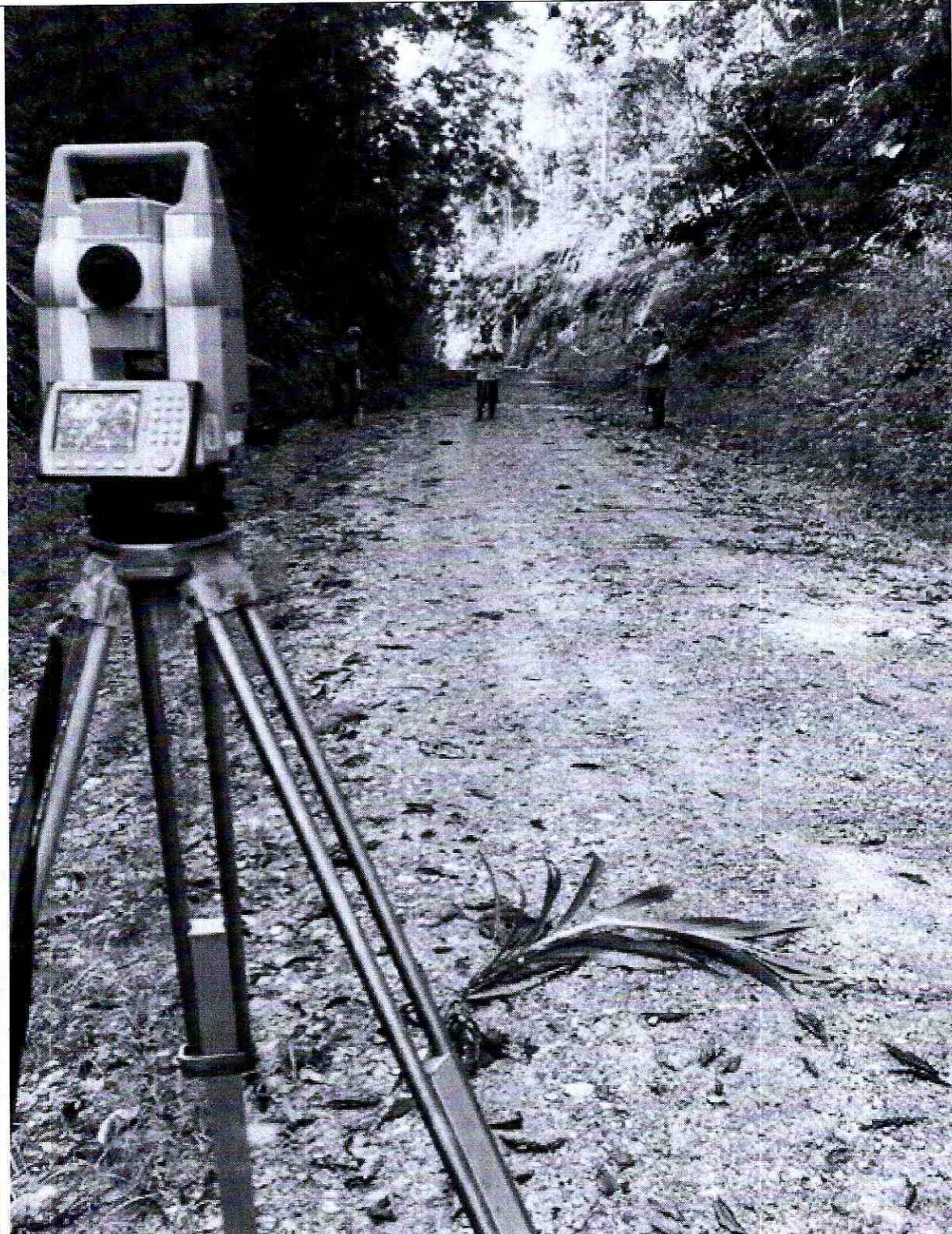
Foto 3: Levantamiento topográfico para proyecto de asfaltado en la Comunidad Meñenpare abscisa 2+500