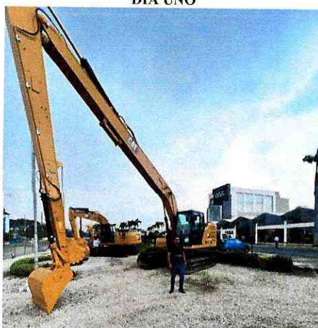
Visitas técnicas empresas de maquinaria pesada.