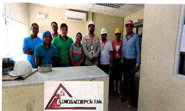
Intercambio de experiencia empresa CALMOSACORP