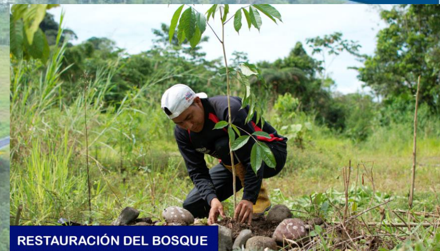
RESTAURACIÓN DEL BOSQUE