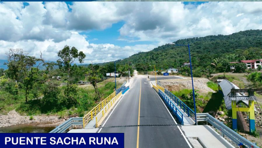
PUENTE SACHA RUNA